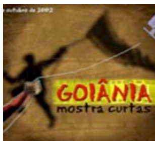
Inscrições para a 10ª Edição do Mostra Curtas vai até dia 17 de setembro

A Secretaria Municipal de Cultura de Goiânia (Secult) informa que estão abertas, até o dia 17 de setembro, as inscrições para as oficinas, seminários e palestras que acontecerão durante a 10ª Edição do Goiânia Mostra Curtas.